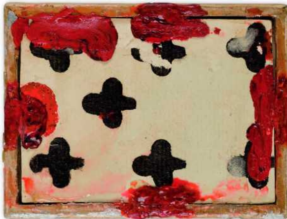
Kuva 5: Kääntöpuolella tukena pelikortti. Henry Lönnforsin miniatyyrikokoelma, Turun taidemuseo. Kuva lehdistökuvana.