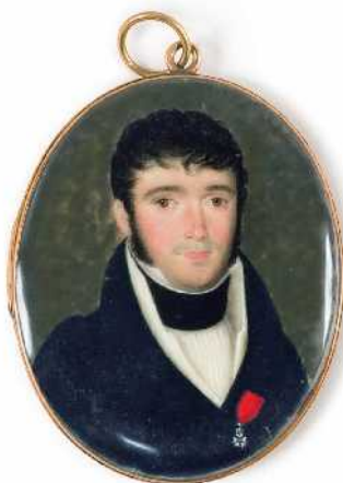
Kuva 2: Tuntematon ranskalainen taiteilija, Miehen muotokuva, 1800-l alku, akvarelli ja guassi norsunluulla. 4,8 x 3,9 cm (valomitta). Henry Lönnforsin miniatyyrikokoelma, Turun taidemuseo. Kuva lehdistökuvaa.

Kannatti vilkaista kirjan viimeisille sivuille, sillä lopussa oli herkkupala: helppolukuinen luettelo lahjoituskokoelman teoksista. Sen avulla miniatyyreihin tutustuminen oli kuin suklaakonvehtien maistelemista kauniista rasiasta. Christian Hoffmannin suunnittelemasta listauksesta sai hyvän yleiskuvan, mitä makuja olisi tarjolla. Kun sitten paneutui lukemaan kirjaa sen pohjalta, oli helppo päästää nauttimaan artikkelien sisällöstä. Mietin kuitenkin, että miniatyyritaiteelle ominaisen mittakaavan vuoksi olisi kerrankin voinut käyttää luonnollisissa koossa olevia kuvia rinnakkain suurennosten kanssa. Mahdollisuutta ei oltu hyödynnetty listan kuvankäsittelyssä.